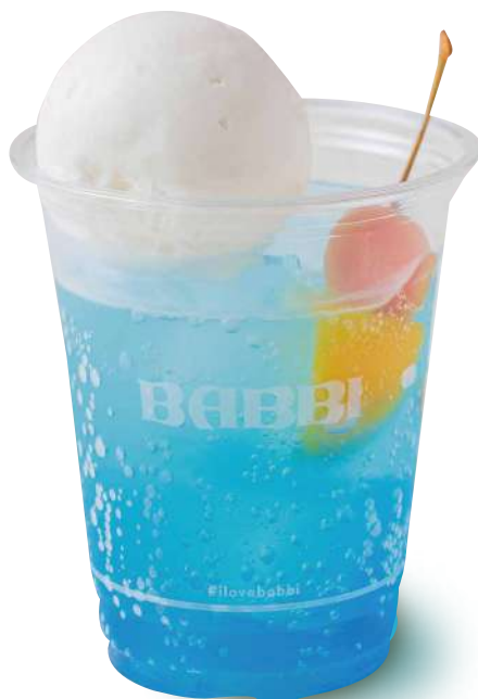
ブルーハワイソーダ フロート Blue Hawaii

抹茶ラテ + 宇治抹茶ジェラート 特定原材料など28品目：乳 Allergen: Milk