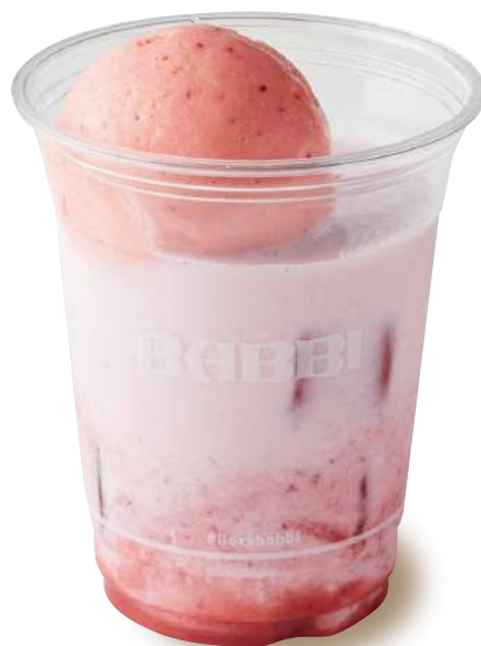
ストロベリーラテ フロート Strawberry Latte

ブルーハワイソーダ + リッチミルクジェラート 特定原材料など28品目：乳 Allergens: Milk