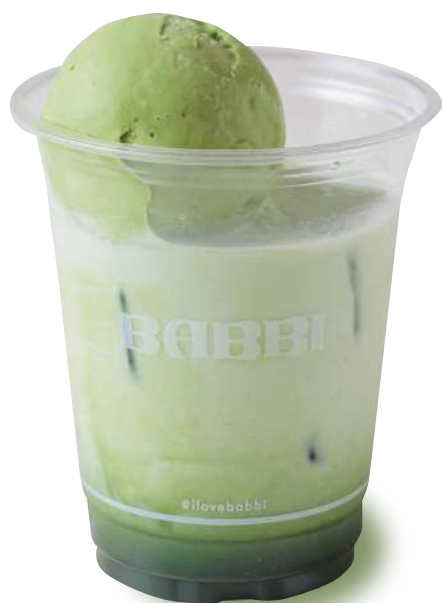
抹茶ラテ フロート Matcha Latte

抹茶ラテ + 宇治抹茶ジェラート 特定原材料など28品目：乳 Allergen: Milk