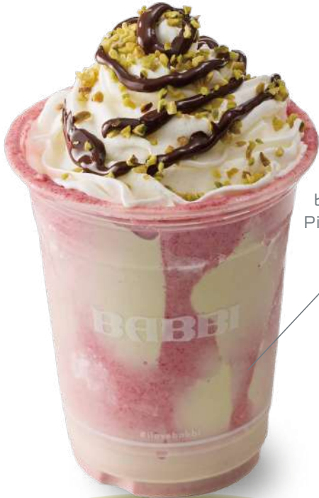
ピスタチオソルベ & ピスタチオジェラート Pistachio Sorbet & Pistachio Gelato

パリッと割れるチョコレートのカップに、 ソルベとジェラート、ミルクを注いで仕上げたフラッペ。 ひとくちごとに食感が変わる、“割って楽しむ”新感覚デザートドリンク。