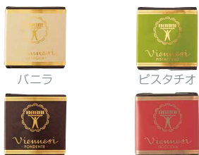
バニラ ピスタチオ チョコレート ヘーゼルナッツ