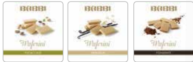
ピスタチオ バニラ チョコレート

BABBIの原点でありながら、いまだトップを走り続けるイタリアの定番スイーツです。食べやすい大きさと分量、上品なパッケージは贈り物にも喜ばれています。