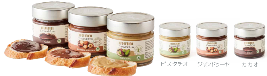
ピスタチオ ジャンドゥーヤ カカオ

パンやクラッカーに塗ってお召し上がりいただく、ペースト状のスプレッドクリーム。フレーバーは、人気のピスタチオをはじめ、ジャンドゥーヤ・カカオの3種類。