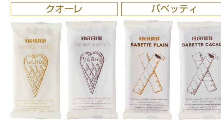
プレーン カカオ プレーン カカオ

幾重にも重ねた薄いクレープ生地が生み出す繊細な食感と香り高く飽きのこない美味しさが魅力のBABBIオリジナル焼菓子。アイスクリームにディップして一緒に楽しむのもおすすめです。