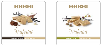
チョコレート & バニラ ピスタチオ & バニラ